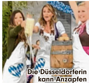
Die Düsseldorferin kann Anzapfen